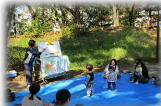
秋の富士見公園も、とっても気持ちが良いです!!